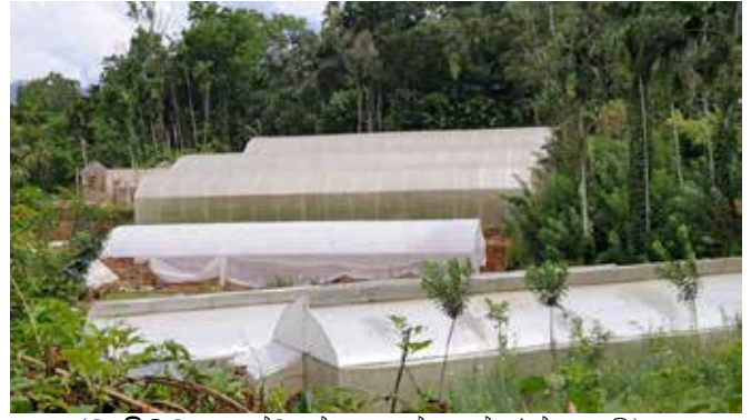
(වැලිමඩ දඳුක්වැල්ල ප්‍රදේශයේ රත්නගාමී)