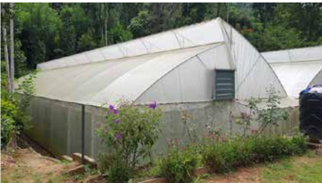
(ලකිඳු ග්‍රීන් හවුස්)

ව්‍යාපෘතිය අඩපණ වෙන්න භාණ්ඩ මිල මෙන්ම ග්‍රීන් හවුස් තුල වගා කිරීමේදී කෘෂි රසායන ද්‍රව්‍ය යෙදීම වැඩි වීම නිසා අධික මුදලක් වැයවීමත්, ඊලචුන් නිසා ග්‍රීන් හවුස් තුලට සිදුවන හානියත් බලපා තිබෙන බවයි ඔහු කියා සිටියේ. කෙසේ නමුත් ලාබයක් නොලැබුණත් ඔහු මේ වන විටත් එම වගා කටයුතු සිදු කරමින් තිබේ.