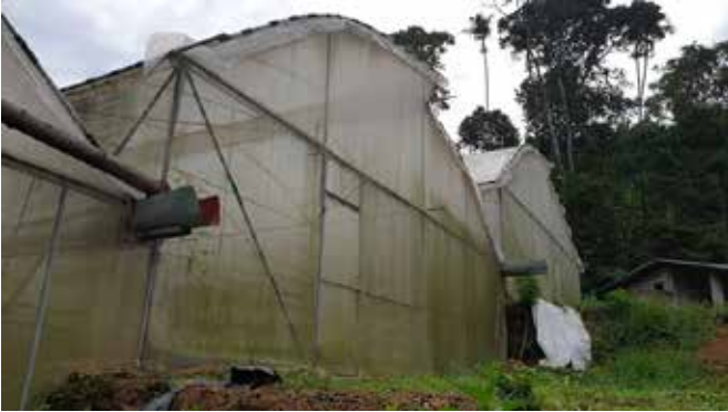
(රොෂාන් රණසිංහගේ ව්‍යාපෘතියේ වර්තමාන ස්වභාවය)

එමෙන්ම ලකිඳු ග්‍රීන් හවුස් ව්‍යාපෘතිය සිදුකරගෙන යනු ලබන බුද්ධික මානවවු මහතා කියා සිටියේ මෙවන් අදහසකි. "මගේ ව්‍යාපෘතිය වෙනුවෙන් රුපියල් ලක්ෂ 71ක් අනුමත වුණා. ඒකෙන් ලක්ෂ 35ක් විතර (359000) මුදලක් මුලින් ලබාදුන්නා. ආධාර ගන්න කලින් වර්ග අඩි 2000ක ග්‍රීන් හවුස් එකකුත් මට තිබ්බා. මේ ව්‍යාපෘතිය වෙනුවෙන් මේ වනවිට මම බැංකු දෙකකින් ලක්ෂ 40ක් ණයට අරගෙන තියනවා. ඒ වෙනුවෙන් මාසයකට වාරික මුදල් ලක්ෂයක් විතර ගෙවනවා".