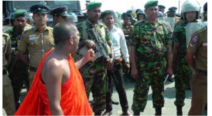
දිනයේ, 2017 ජනවාරි මස 08 වනදා දින හම්බන්තොටදී