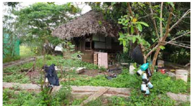
(Thampa Model Farm)