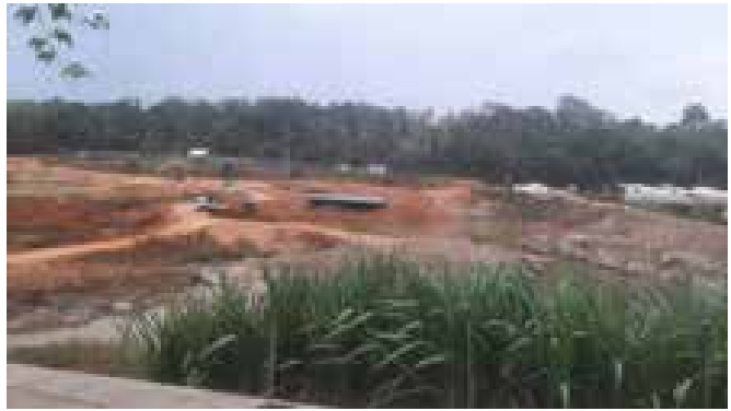
(ඉහත ඡායාරූප - අන්තර්ජාලයේ ඇති බෝලගල